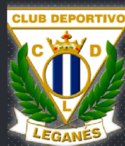
Club Deportivo Leganés SAD