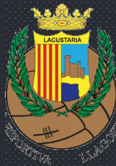
Unió Esportiva Llagostera