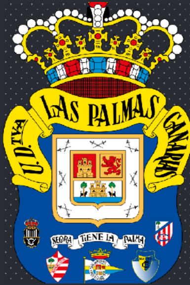
U.D Las Palmas

JEP Sports Management cuenta con una red de contactos en Clubes de fútbol en España y en el extranjero.