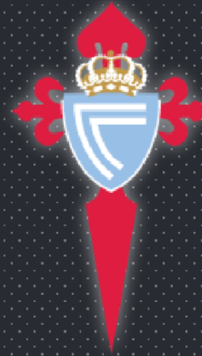
Real Club Celta de Vigo SAD